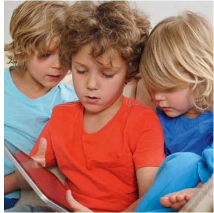
Tijdens het spelen raken de hoofden elkaar en kan hoofdluis zich verspreiden.

Hoofdluizen zoeken graag een warm plekje op; bijvoorbeeld in het haar achter de oren, in de nek of onder een pony. Kinderen krijgen gemakkelijk hoofdluis, omdat tijdens het spelen de hoofden elkaar soms raken. Hoofdluizen verspreiden zich ook makkelijk bij pubers. Dat kan bijvoorbeeld gebeuren bij het knuffelen, samen selfies maken of bij elkaar op de mobiel kijken.